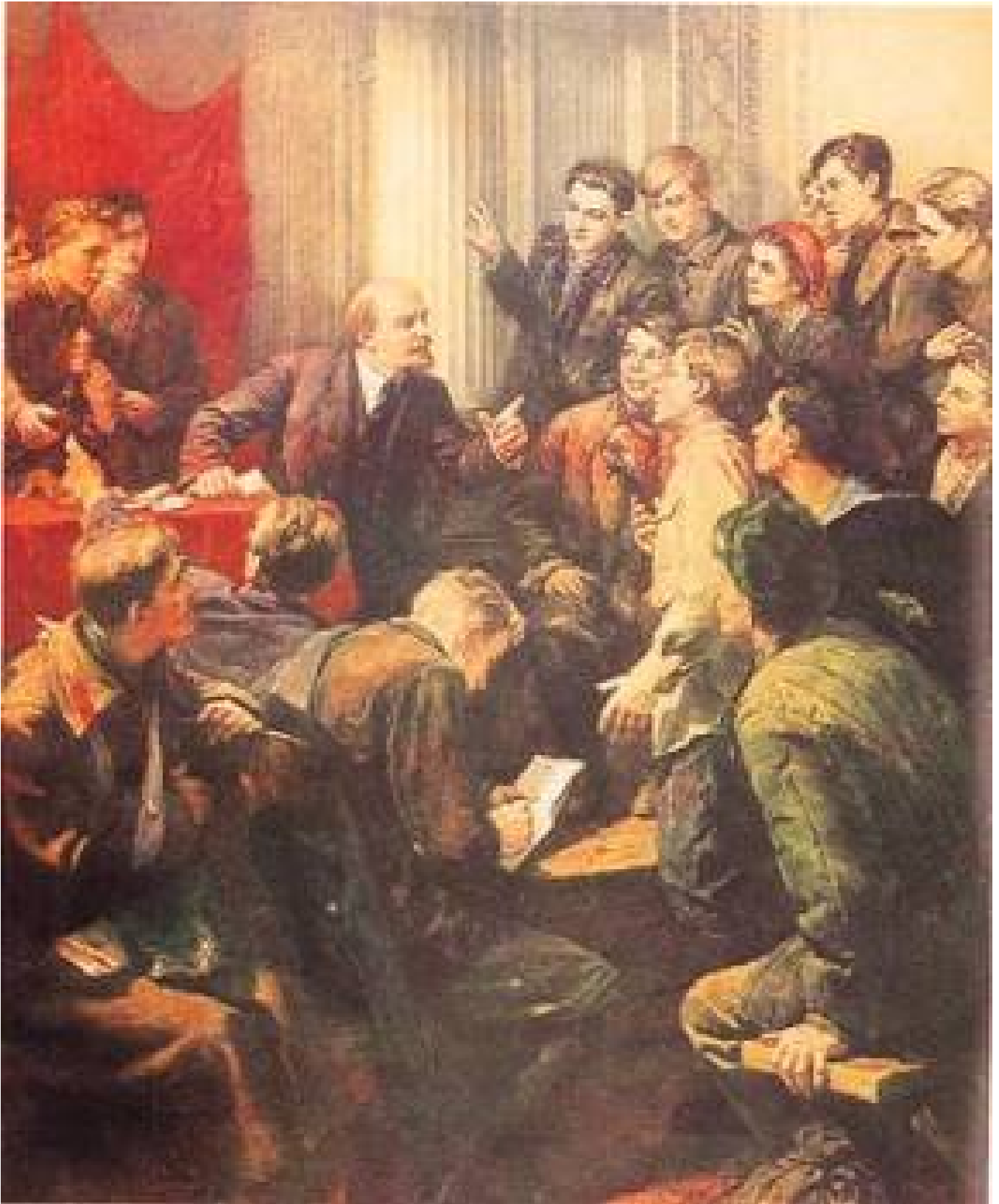
Ο Λένιν με Κομσομόλους

Σύντροφοι, θα 'θελα να κάνουμε σήμερα μια συζήτηση πάνω στο θέμα: ποια είναι τα βασικά καθήκοντα της Ενωσης της Κομμουνιστικής Νεολαίας και σε σύνδεση μ' αυτό, τι λογής πρέπει να είναι οι οργανώσεις της νεολαίας στη σοσιαλιστική δημοκρατία γενικά. Ένας λόγος παραπάνω να σταθούμε περισσότερο στο ζήτημα αυτό είναι ότι με μίαν ορισμένη έννοια μπορούμε να πούμε ότι ίσα-ίσα μπροστά στη νεολαία μπαίνει το πραγματικό καθήκον να δημιουργήσει την κομμουνιστική κοινωνία. Γιατί είναι φανερό ότι η γενιά των εργαζομένων που διαπαιδαγωγήθηκε