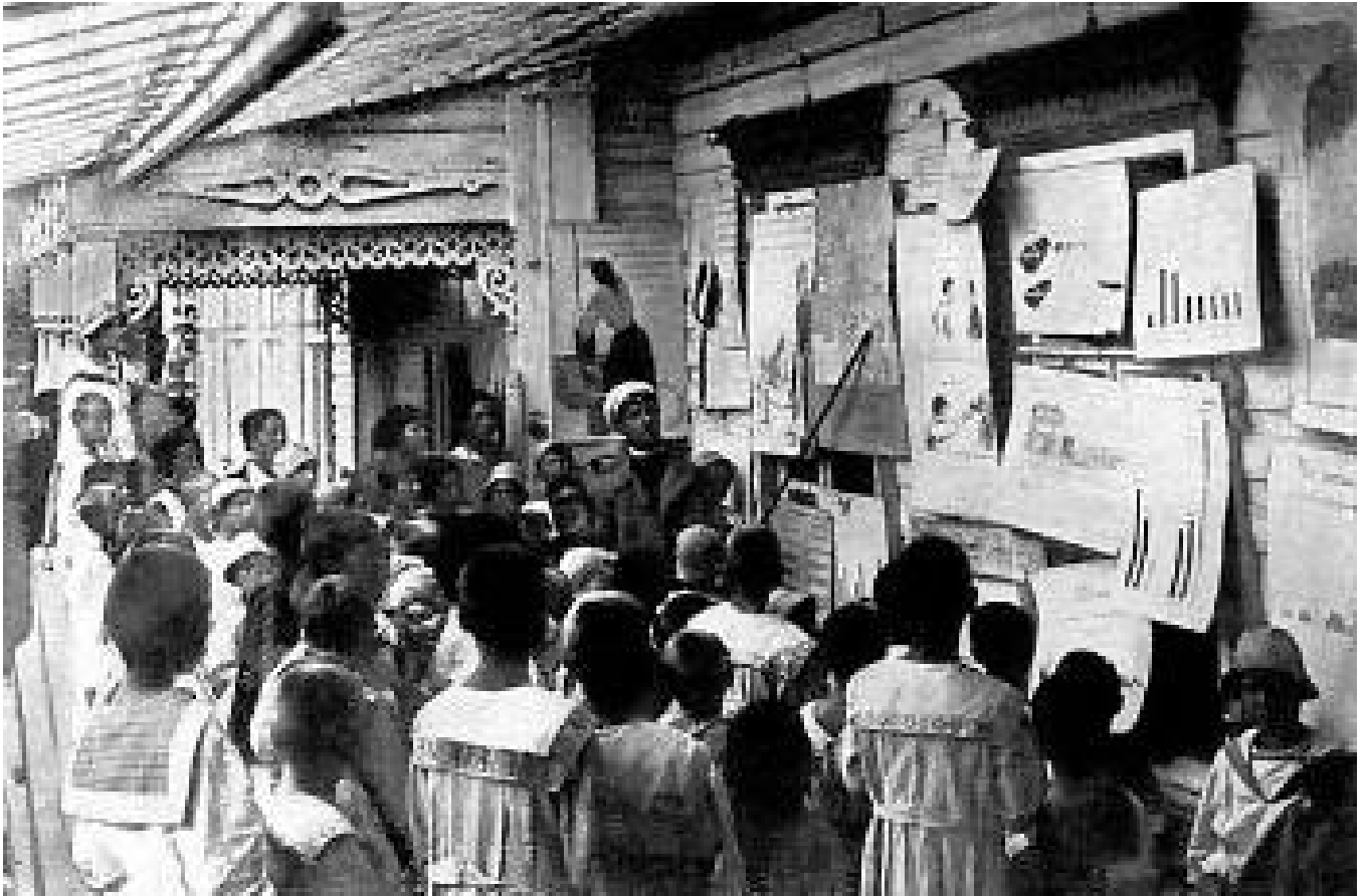
ΕΣΣΔ: Υπαίθριο, μετακινούμενο σχολείο για τα παιδιά των αγροτών, τη δεκαετία του 1920

Ακόμα πιο επικίνδυνο θα ήταν αν αρχίζαμε ν' αφομοιώνουμε μόνο τα κομμουνιστικά συνθήματα. Αν δεν είχαμε καταλάβει έγκαιρα αυτό τον κίνδυνο και αν δεν είχαμε κατευθύνει όλη τη δουλειά μας στο να τον εξαφανίσουμε, τότε το μισό ή ένα εκατομμύριο νέοι – αγόρια και κορίτσια – που ύστερα από μια τέτοια μελέτη του κομμουνισμού θα ονομάζονταν κομμουνιστές, θα έφερναν μόνο μεγάλη ζημιά στην υπόθεση του κομμουνισμού.